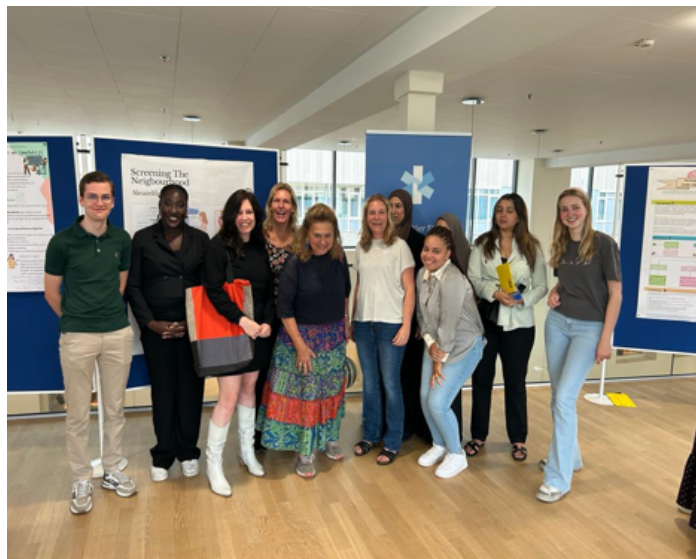
JWS in gesprek met Studenten Haagse Hogeschool